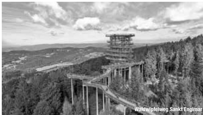
Waldwipfelweg Sankt Englmar

Auf den Spuren unserer Vorfahren – Eine spannende Zeitreise in die Welt der Neandertaler und Kelten! Beim Betreten der dunklen Klausenhöhlen im Archäologiepark Altmühltal taucht man ein in eine Welt vor über 10.000 Jahren und schickt seine Fantasie auf eine aufregende Reise in die Vergangenheit. treffpunktdeutschland.de/altmuehltal