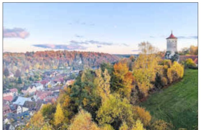
4. Platz: „Farbenfroher Beutel“ Timmy Hohnecker aus München