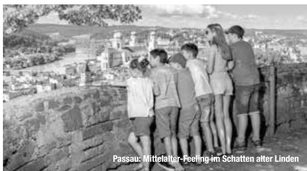
Passau: Mittelalter-Feeling im Schatten alter Linden

Reiseführer. Reisemagazine. Freizeittipps.