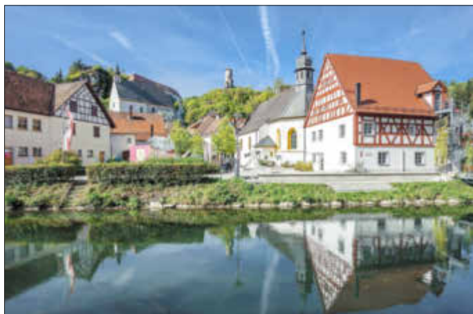
4. Platz: „Waischenfeld“ Hanspeter Müller aus Hollfeld