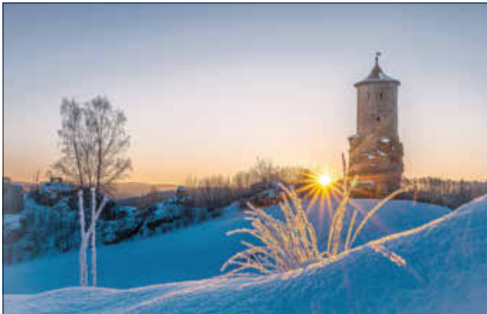
2. Platz: „Burg Waischenfeld im Frost bei -19°“, Thorsten Lehmann aus Niedermirsberg