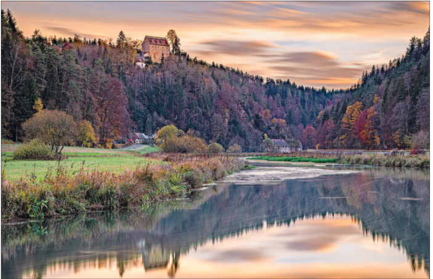
1. Platz: „Burg Rabeneck Sonnenuntergang im Herbst“, Thorsten Lehmann aus Niedermirsberg