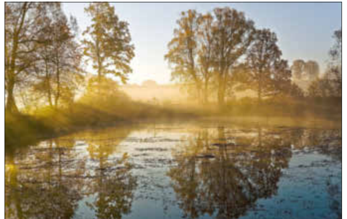
3. Platz: „Novemberweiher, Eichenbirkg“, Klemens Haas aus Eberstalzell, Österreich