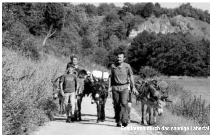
Eseltouren durch das sonnige Labertal