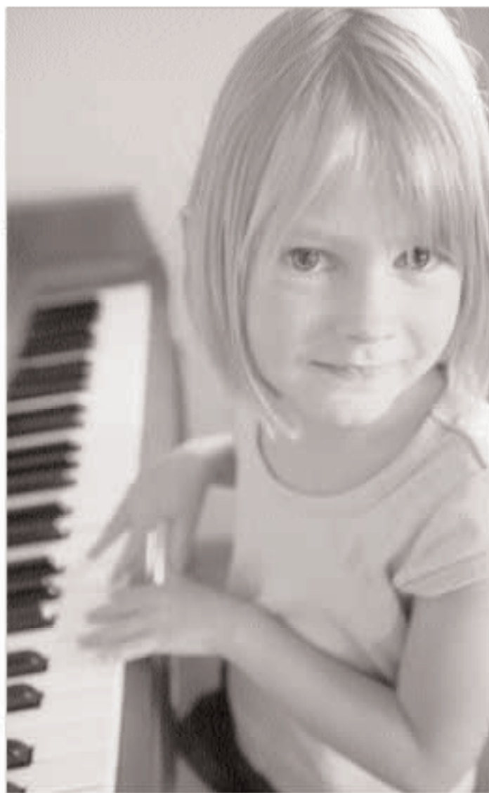
„Musik bewegt“, lautet diesmal das Motto des Nationalen Förderpreises 2008.

Bewerben können sich Träger von Projekten – etwa Vereine, Wohlfahrtsverbände, Stiftungen, Institutionen, Verbände und Kirchen – die junge Menschen bis zu 25 Jahren durch musikalische Aktivitäten unterstützen. Gefördert werden zum Beispiel Musiktherapie-Angebote für Kinder mit Behinderungen oder Traumata, integrative Musik-Initiativen für Kinder mit Migrationshintergrund und Musikprojekte für benachteiligte Hochbegabte. Die drei ersten Preise sind dotiert mit 25.000 Euro, 20.000 Euro und 15.000